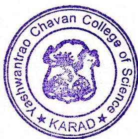
Principal, Yashwantrao Chavan College of Science, Karad